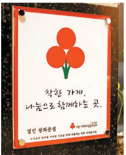
사랑의열매 '착한가게' 가입 업체에 제공되는 현판.

업종은 병원·학원·카페·약국·미용실·주유소·PC방 등 다양하다. 같은 업종이나 브랜드 가게 대표들이 단체로 가입하기도 한다. 서울 소재 동대문엽기떡볶이 18개소, 하이모 62개소 등이 단체 가입을 한 경우다. 2020년에는 대한제국협