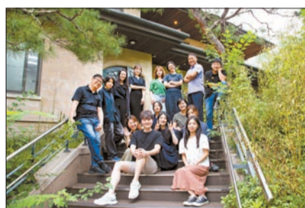
서울 종로구 '동락가'에 입주한 비영리스타트업 구성원들.

초기 비영리조직이 성장하는데 필요한 멘토링, 교육 프로그램도 이곳에서 진행됐습니다. 활동가들을 위한 네트워킹 행사도 열렸습니다. 지금까지 동락가를 방문한 누적 인원은 총 5174명. 건