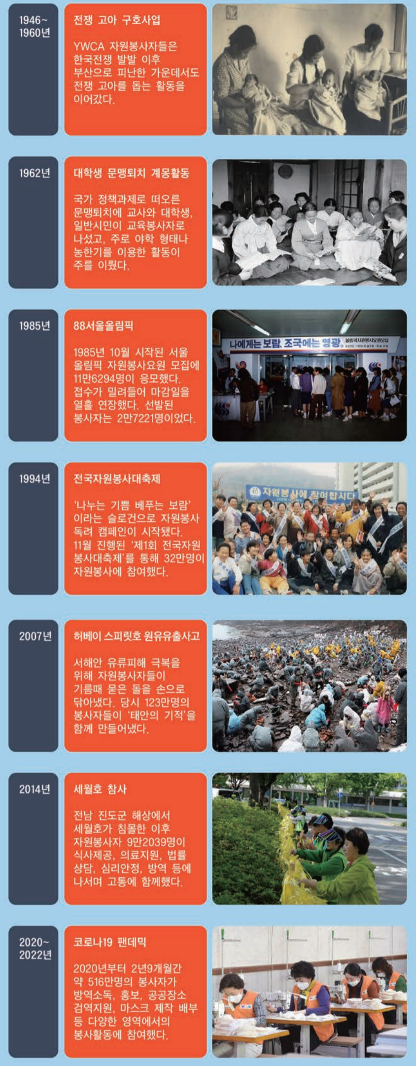
자료: 한국중앙자원봉사센터, 국가기록원, 한국YWCA연합회