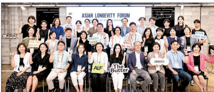
지난달 26일 서울 강남구 마루180에서 기업·비영리·학계·법조 전문가 40여 명이 참석한 가운데 '아시안 롱제비티 포럼(ALF)' 출범식이 열렸다.