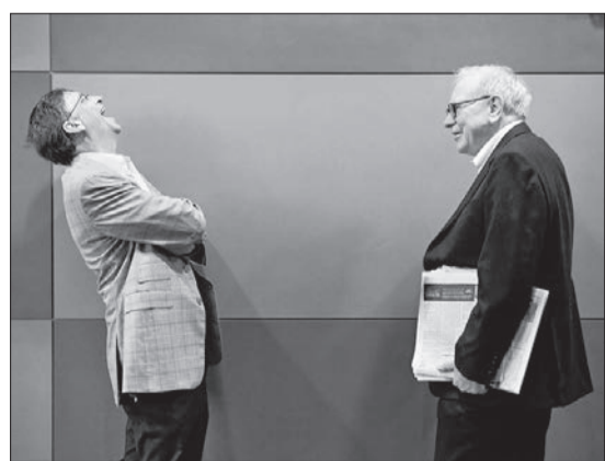
빌 게이츠(왼쪽)와 워런 버핏.

국내 소셜섹터 전문가 5인(도현명 임팩트스퀘어 대표, 방대욱 다음세대재단 대표, 임성택 지평 대표변호사, 황신애 한국모금가협회 상임이사, 허재형 루트임팩트 대표)의 도움을 받아 국내외 뉴 필