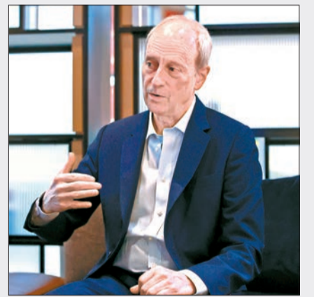
마이클 샌델 하버드대 교수.