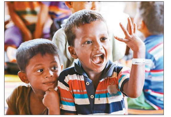
분쟁을 피해 난민촌에 온 아이가 난민등록 팔찌를 차고 있는 모습.

“오늘이 마지막 날인 것처럼 사세요. 숨 쉬고 살아 있다는 것 자체가 큰 축복입니다. 그걸 나눌 수 있다면 더없는 행복이죠.” 문일요 더버터 기자