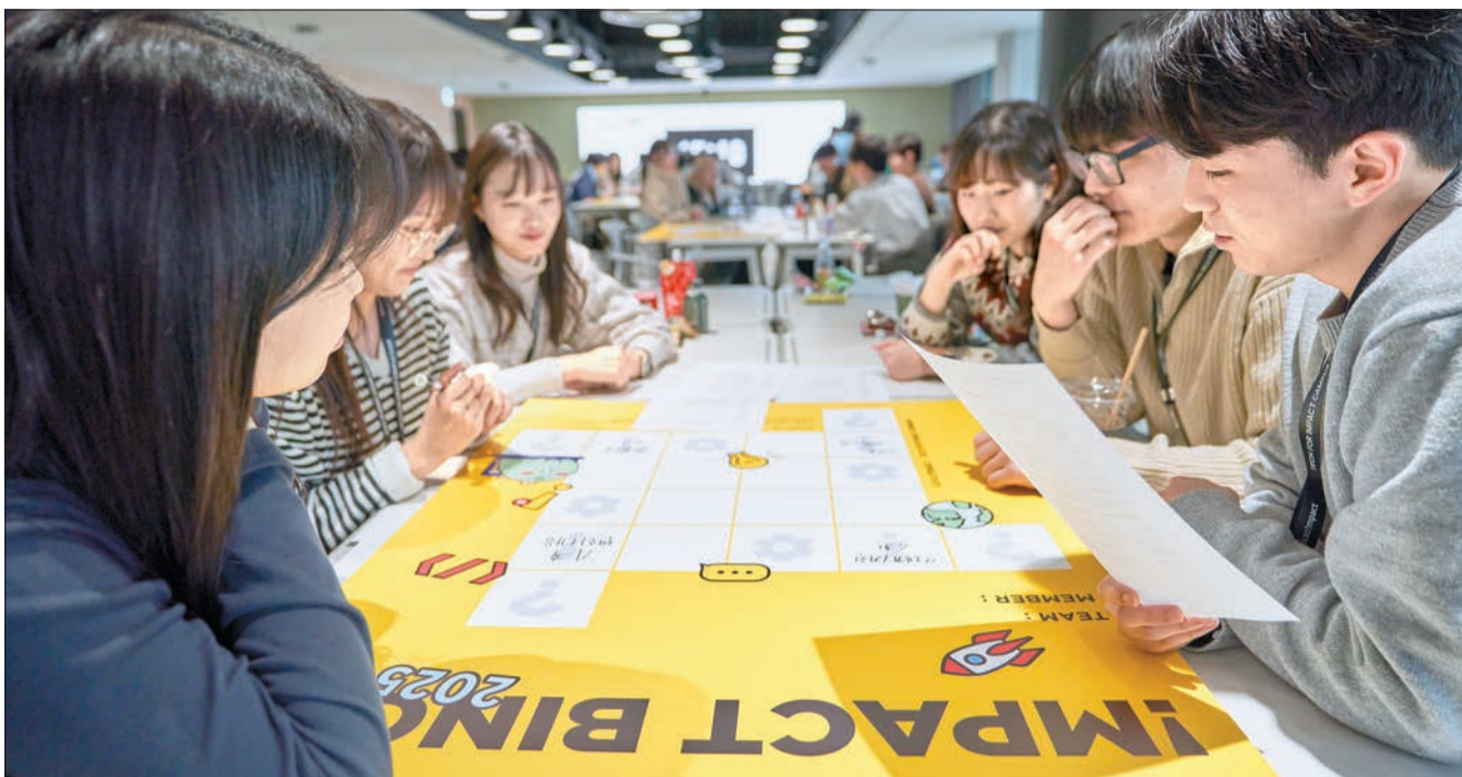
지난달 3일 열린 ‘테크포임팩트 캠퍼스’ 개강 워크숍에는 수강생을 포함해 브라이언 펠로우, 카카오 개발자 멘토 등이 참여했다.