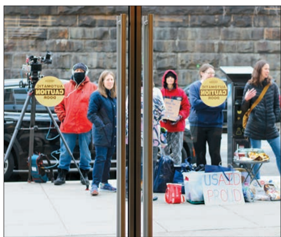
지난달 13일(현지시간) 미국 국제개발처에서 해고된 직원들이 개인 짐을 찾아 떠나고 있다.

USAID 폐쇄 움직임에 유엔을 포함한 국제기구들은 지난 2월부터 비상 체제에 돌입했다. 불과 올 초까지만 해도 전 세계 각지에서 국제원조 사업을 진행하는 1만 명이 넘는 USAID 직원이 업무를 중단하면서다. 지난달 3일 미 정부는 워싱턴DC의