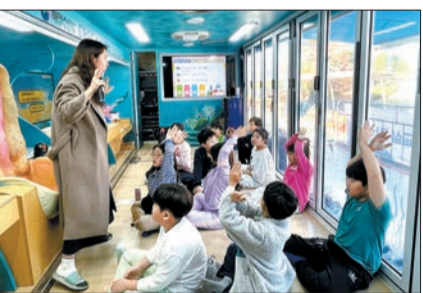
‘해양환경 이동교실’ 수업

커다란 차 안에서 초등학생 여럿이 우르르 쏟아져 내린다. 소감을 묻자 학생들은 연신 “재미있었다”거나 “몰랐던 사실을 알게 돼 가족들에게도 알려 줄 것”이라며 앞다투어 목소리를 냈다. 해양환경공단이 내륙·도서·벽지 지역 학교를 대상으로 운영하는 이동식 해양환경교실 ‘파랑해(Far랑海)’ 사업에 참여한 학생들의 반응이다.