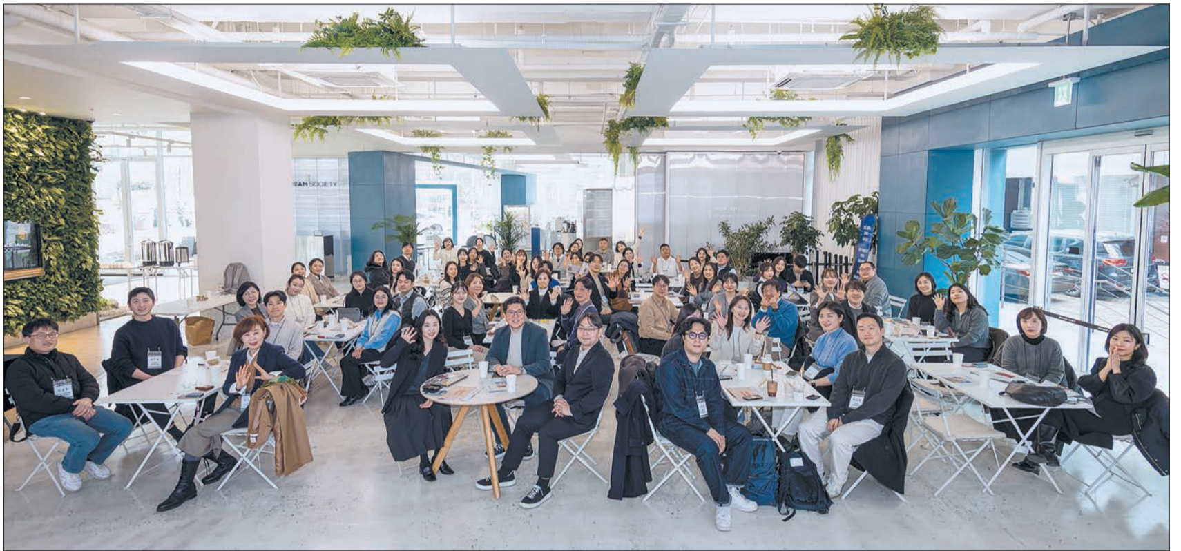
18일 서울 중구 온드림소사이어티에서 열린 '넥스트CSR포럼'에는 60개 기업·재단 관계자 80여 명이 참석했다.