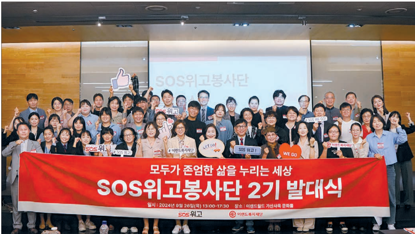
지난해 9월 서울 금천구 이랜드 사옥에서 ‘SOS위고 봉사단’ 2기 발대식이 열렸다.