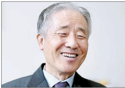
국제시장 구두쇠, 1300명 아동 돕다 우한곤 기부자

그는 그 시절 누군가의 작은 도움이 얼마나 절실했는지 기억하고 있었다. “큰 아들을 집안 형편 때문에 대학에 보내지 못한 것이 지금도 마음 아픕니다. 누군가에게 작은 도움이라도 되고 싶다는 마음으로 기부를 계속하고 있습니다.”