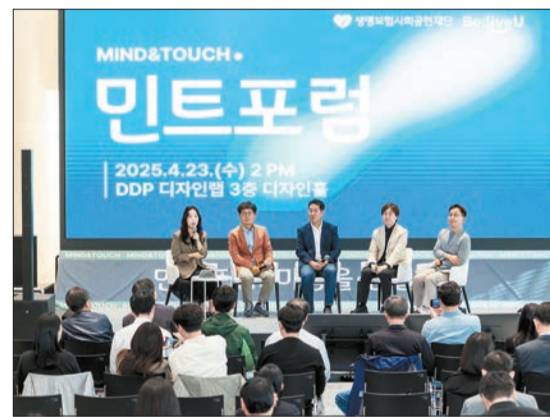
지난달 23일 서울 중구 동대문디자인플라자(DDP)에서 열린 ‘제1회 민트포럼’ 현장.

2부에서는 동양철학·정신의학·뇌과학 분야 전문가들이 연사로 나섰다. 박재희 석천학당 원장은 ‘동양철학에서 찾은 마음 처방’을 주제로 마음 회복력을 지키는 세 가지 방법을 소개했다. 첫 번째는 희로애락 네 가지 감정 중 어느 하나가 지나치