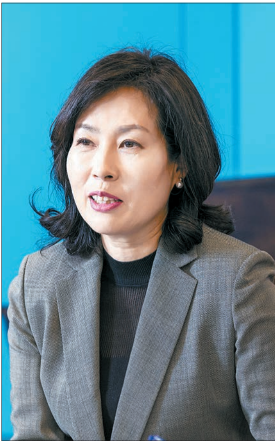
지난달 24일 서울 마포구에 있는 유니세프 한국위원회에서 ‘학생마음건강증진법안’에 관한 대담이 벌어졌다. 류현 유니세프 아동권리실장, 우지향 서울선사고 전문상담교사와 법안을 발의한 서지영 국회의원(왼쪽부터)이 대담에 참여했다.