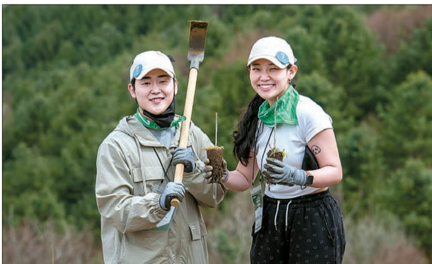
지난달 12일 강원 인제 자작나무숲에서 열린 '신혼부부 나무심기'에 참가한 부부.

신혼부부들을 숲으로 불러 모은 건 유한킴벌리다. 유한킴벌리는 국내 최장수 숲환경 공익 캠페인 '우리강산푸르게푸르게' 사업의 일환으로 올해로 41년째 '신혼부부 나무심기' 행사를 주최하고 있다. 결혼 3년 이내 신혼부부나 결혼을 확정된 예비부부라면 누구나 참여할 수 있다. 기후변화와 산불 이슈에 대한 관심이 늘면서 프로그램 인기도 매년 높아지고 있다. 올해는 역대 최고 경쟁률인 21대 1을 기록했다. 높은 경쟁률을 뚫고 선정된 신혼부부 106쌍과 유한킴벌리 임직원, 협력기관인 생명숲·산림청·인제군 관계자 350명이