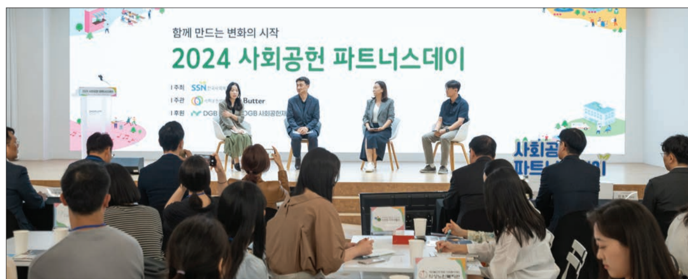
‘2024 사회공헌 파트너스데이’에서 열린 토크콘서트에 참석한 전문가들이 ‘사회공헌 분야의 협력을 주제로 각자의 경험을 말하고 있다.

오는 9월 열리는 ‘2025 사회공헌 파트너스데이’에서는 기업·공공기관 관계자들이 참여한 가운데 제안 사업을 발표하고, 구체적인 사업 내용을 전시하면서 함께할 파트너를 모색할 수 있다. 이번 행사 당일에는 총 5팀의 우수 사업제안팀을 선정해 ▶최우수상 300만원(1팀) ▶우수상 200만원(2팀) ▶장