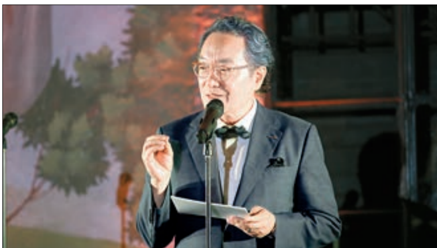
조명환 한국월드비전 회장이 바티칸에서 열린 국제포럼에서 아동 구호를 위한 글로벌 연대의 필요성을 강조하고 있다.

연구진은 알바니아, 볼리비아, 이라크, 레소토, 세네갈, 스리랑카, 태국, 우간다 등 8개국 어린이 658명을 대상으로 자신이 일상 속에서 사랑·어려움·신념·희망 등을 어떻게 경험하고 느끼는지에 대한 심층 인터뷰를 진행했다. 월드비전과 하버드대, 듀크대 등으로 구성된 연구진은 인터뷰 결과를 분석한 뒤 문화적 차이를 반영하고 신뢰도를 높이