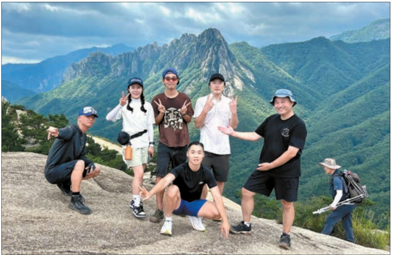
지난해 9월 강원 고성 청년마을 '곶마을'에서 진행한 지역살이 프로그램 '살아보세 금수강산' 참가자들.

지역 네트워크는 사업을 속도감 있게 추진하는 자산이 되기도 한다. 경북 영주 청년마을 '소백산예술촌'을 이끄는 조국원(33) 클라우드컬처스 대표는 20