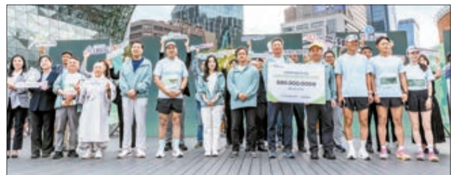
'2026 마인드마라톤' 개최 행사에서 기부금 전달식이 진행됐다.

요즘 많은 분에게 걷고, 뛰고, 달리라고 권한다. 가까운 공원 한 바퀴를 걷는 것부터 시작해도 좋다. 천천히 달려보는 것도 좋다.